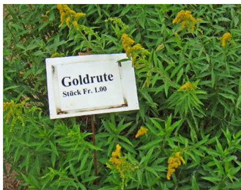
1: Solidage géante interdite, mais en vente

Zürich, 14.06.2017. La Spin-off IN-FINITUDE de l'EPFZ saisit le problème par la racine. Avec le développement de sa propre plate-forme web interactive « Pollenn »®, elle met en réseau communes et propriétaires et les soutient dans la lutte contre les néophytes envahissantes.